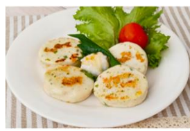
(レシピ例)ミニハンバーグ風 さっと焼いて香ばしさをプラスしたハンバーグ風に