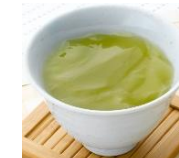
出来上がりがイメージ緑茶ゼリーの素