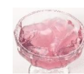
出来上がりがイメージぶどう味

体液に近い電解質バランスに仕上げました。やさしい甘さで口当たりの良いゼリーです。