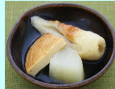
大根・ちくわ・さつま揚げ各10個入り/袋

大根・ちくわ・さつま揚げが入った炊き合わせです。かつおと昆布をベースに、魚介類の風味を加えた、和風出汁を使用。