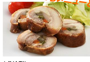
(盛付例)商品はスライスしてありません。