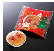
Fe : 1.0mg/個

株式会社 70788939 冷蔵 新クリスマス 米粉のカップケーキ(鉄) 25g×40/箱