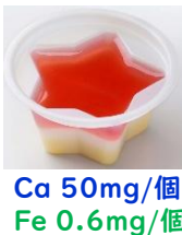
Ca 50mg/個 Fe 0.6mg/個

2層の豆乳風味のプリンの上に国産のいちごソースをかけた3層タイプのデザートです。